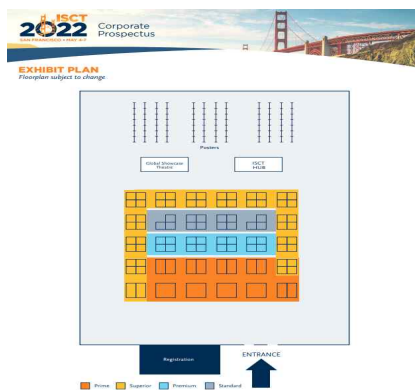
ISCT 2022 Exhibit Floor plan (모집 수에 따라 세부 부스위치 배정 예정)