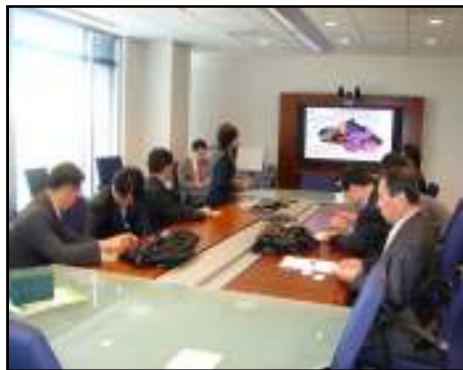
경상북도 사절단 시찰시