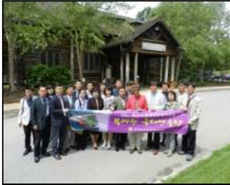
전남 중견간부사원 연수팀 시찰시