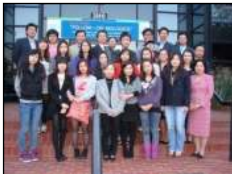
순천향대학교 인재양성 대학생팀 시찰시