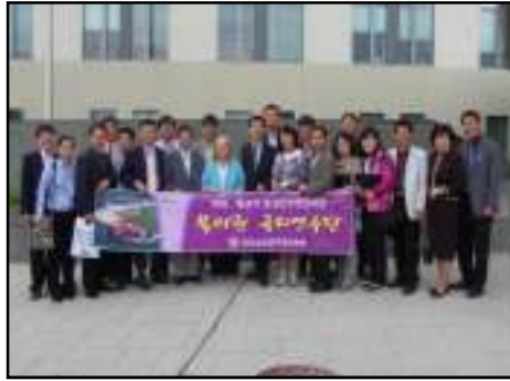
전남 중견간부사원 연수팀 시찰시