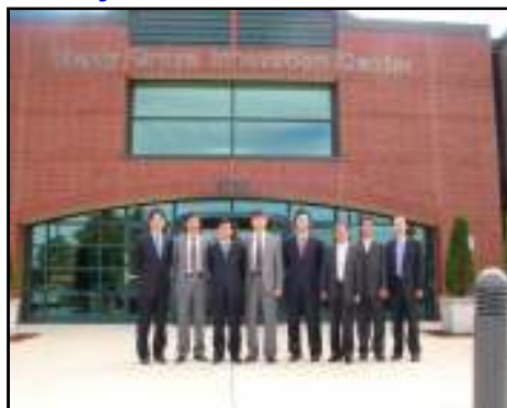
경상북도 사절단 시찰시