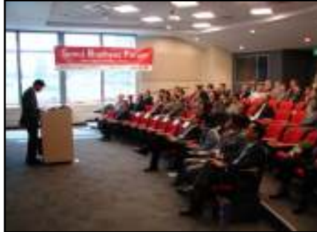
서울특별시 시찰시 투자설명회