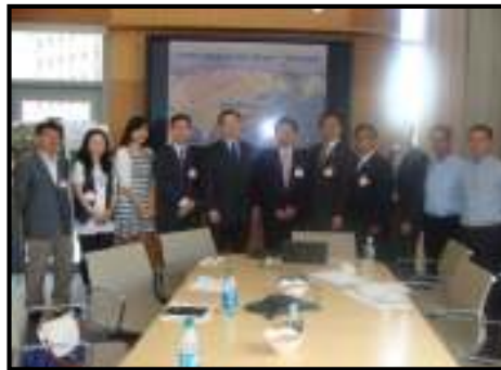
한국바이오협회 임원단 시찰시