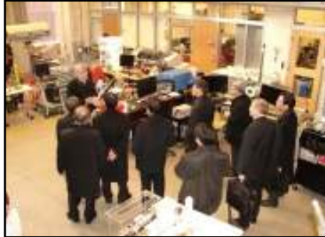
한밭대학교 시찰시 MOU체결