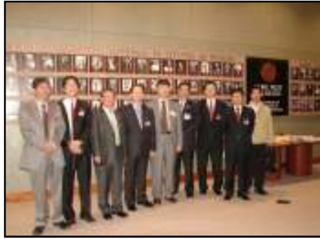
경상북도 사절단 시찰시